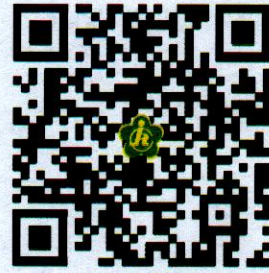
市残联权力事项清单